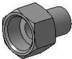
Рис.1 Внешний вид соединительной пары