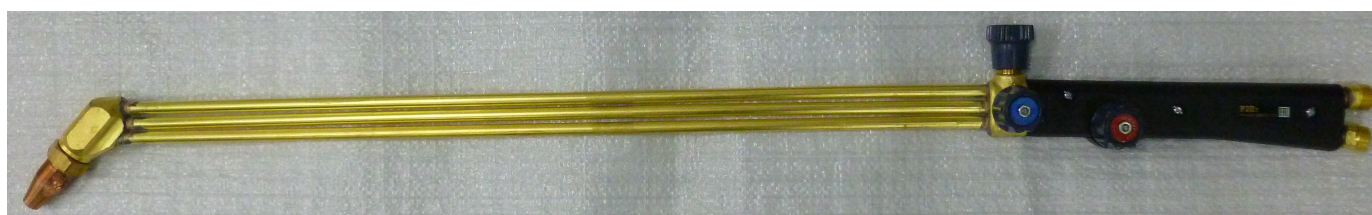
Рис 2 Резак в сборе РЗПт (L=840 мм) с углом наклона мундштуков 135°

1- клапан режущего кислорода; 2- клапан подогревающего кислорода; 3- клапан горючего газа; 4- ствол; 5- корпус мундштуков; 6- гайка смесителя; 7- наружный мундштук; 8- внутренний мундштук.